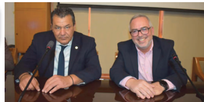
ΤΕΘΗΚΑΝ ΕΠΙ ΤΑΠΗΤΟΣ ΣΤΗΝ ΗΜΕΡΙΔΑ ΕΝΗΜΕΡΩΣΗΣ ΠΟΥ ΟΡΓΑΝΩΣΕ Ο ΔΗΜΟΣ