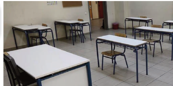
ΣΥΜΦΩΝΑ ΜΕ ΤΟΝ ΠΡΟΓΡΑΜΜΑΤΙΣΜΟ ΤΟΥ ΚΛΙΜΑΚΙΟΥ ΤΟΥ ΟΑΣΠ